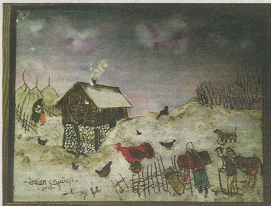
Kulturprojektet "Vägskäl" i Leksand firar tjuugo år med en spretig men samtidigt sammanhållen "reperspektiv" utställning.